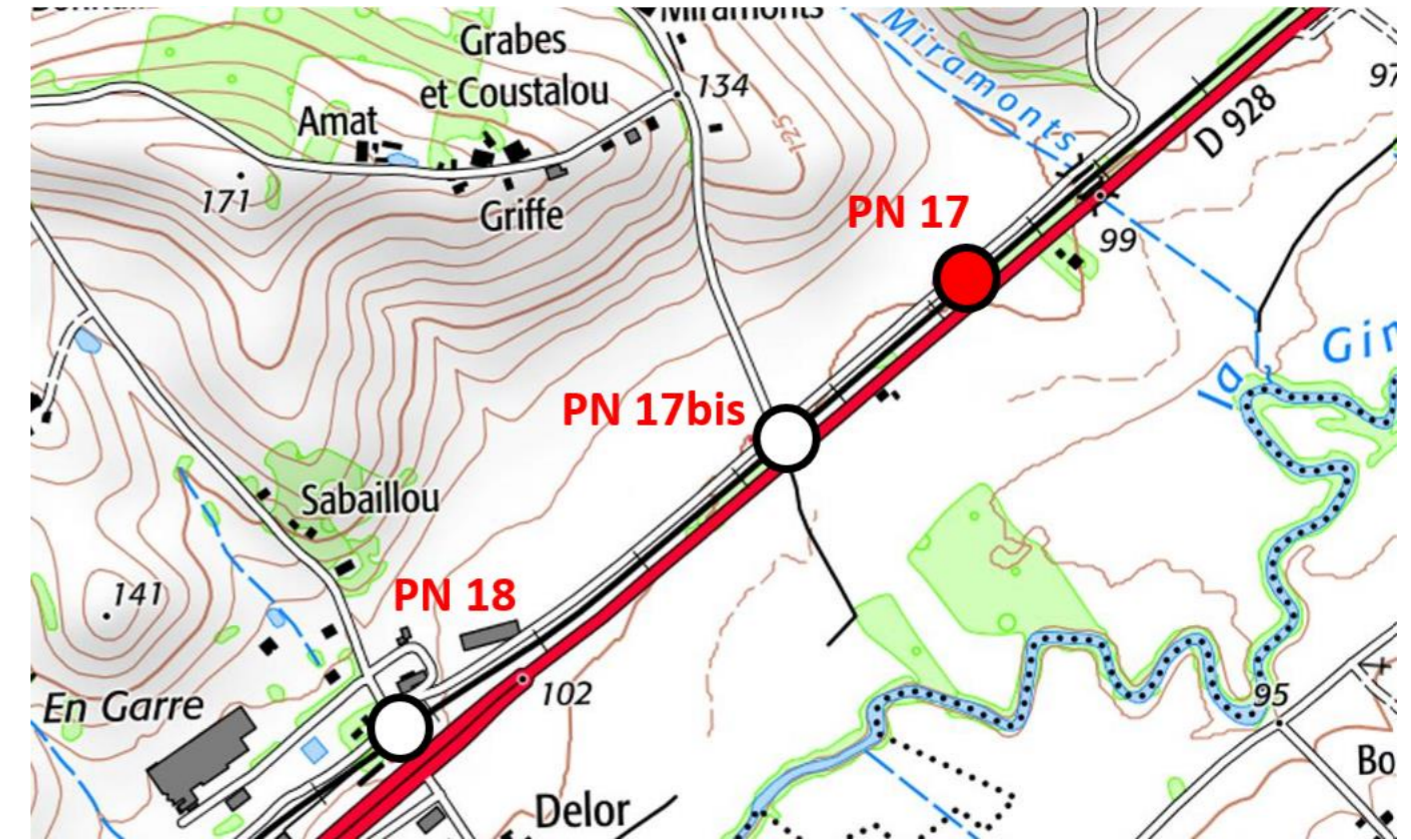
Figure 2 : Plan de situation du PN 17