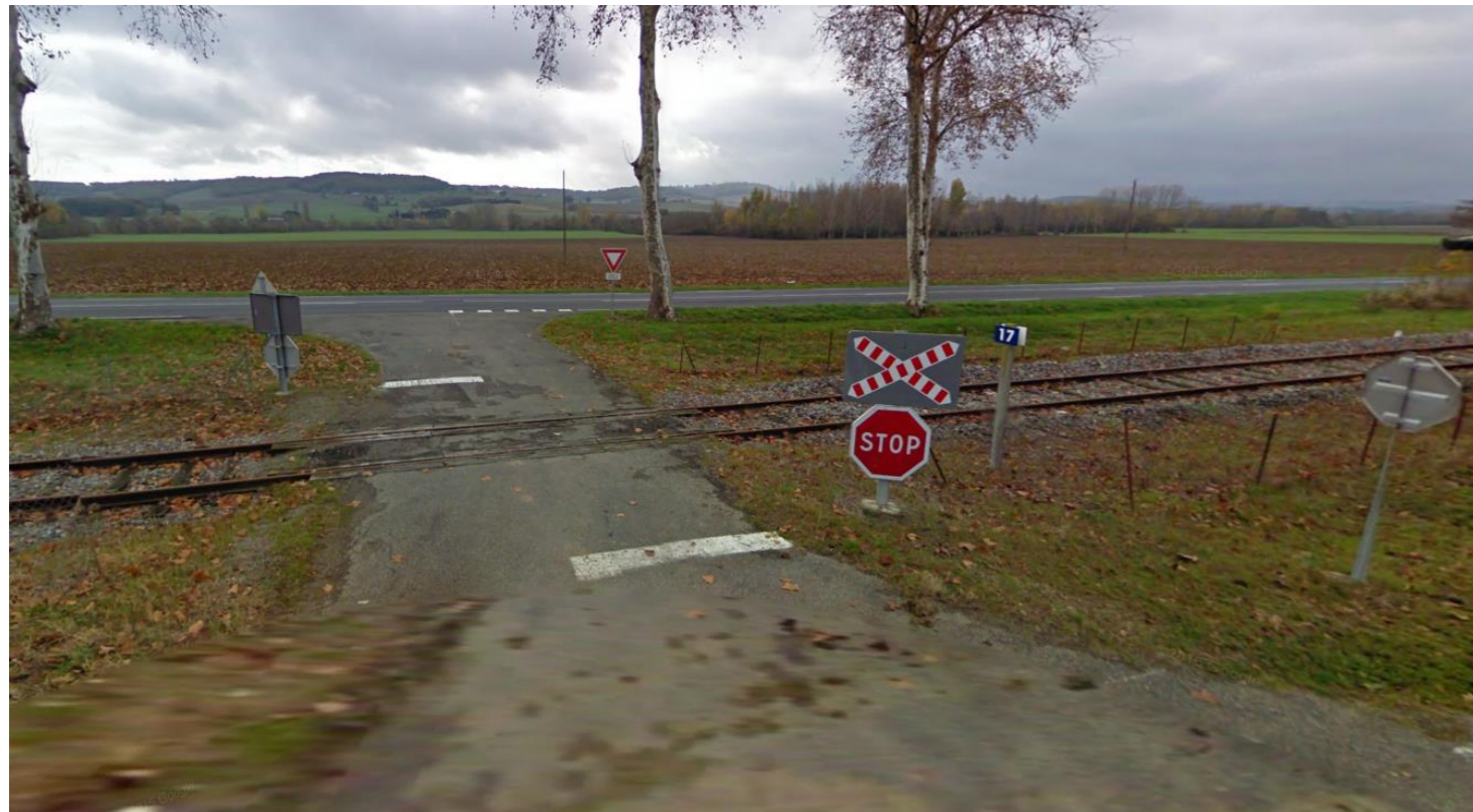
Figure 1 : Photo du PN n°17

Ce PN est situé en milieu rural à proximité immédiate de la RD 928. La distance séparant le PN et la RD 928 est réduite ce qui motive la suppression du PN 17 (motif de sécurité, risque de remontée de file sur le PN).