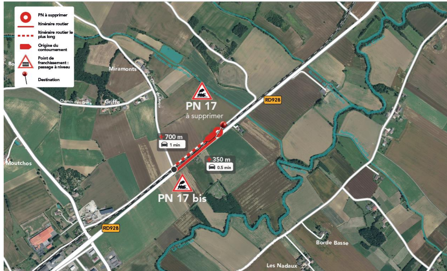
Figure 3 : Solution de suppression

Le projet consiste en une suppression simple du PN n°17. En effet, un itinéraire alternatif simple et existant permet de contourner ce passage à niveau. Celui-ci consiste à emprunter le passage à niveau voisin n°17bis (passage à niveau public pour voiture sans barrière avec croix de St-André et stop). Le PN 17bis est plus éloigné de la RD 928, l'insertion des véhicules est ainsi moins dangereuse. Cette solution a été réfléchi conjointement entre SNCF Réseau, INGEROP et la Communauté de Communes de la Lomagne Tarn et Garonnaise, représentée par M CASTEBRUNNET.