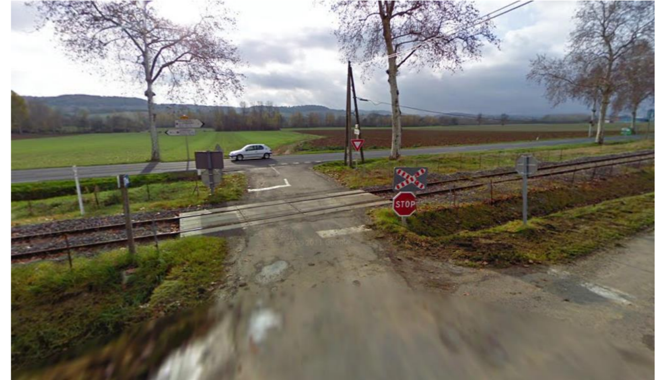
Figure 4: Photographie du PN 17bis permettant le contournement